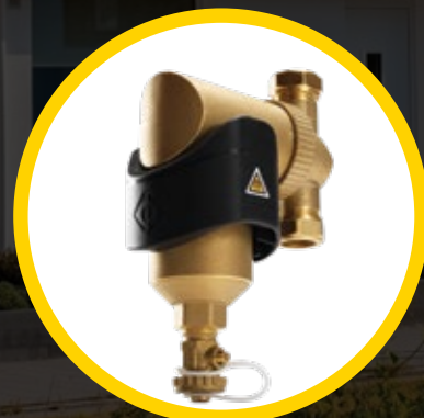
SPIROTRAP® MB3 MAGNETISCHE VUILAFSCHEIDER