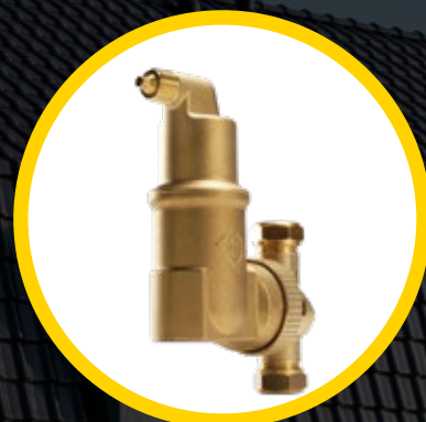
SPIROVENT® RV2 MICROBELLENLUCHTAFSCHEIDER