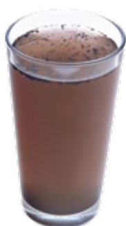
Met magnetiet vervuild water

De belangrijkste oorzaak van vervuiling is corrosie als gevolg van de reactie tussen (de lucht in) water en de ijzerhoudende onderdelen in de installatie. Vervuiling in een installatie bestaat grotendeels uit het schadelijke magnetiet. Een duidelijke aanwijzing voor de aanwezigheid van magnetiet is het zwart kleuren van het installatiewater. Opgehoopt en vastzittend magnetiet hindert een optimale werking van de installatie en leidt tot overmatige slijtage en storingen.