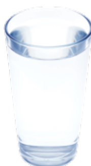
Water met minimale aanwezigheid van magnetiet

De vervelende en soms kostbare gevolgen van vervuiling in het installatiewater kunnen worden voorkomen met een magnetische vuilafscheider. Met deze vuilafscheider wordt magnetiet extra snel uit het installatiewater gehaald. Een installatie met schoon water is veel minder storingsgevoelig en zorgt ervoor dat de ketel zo zuinig mogelijk brandt en dat de pomp zo min mogelijk stroom verbruikt. De magnetische vuilafscheider wordt ondersteunt door alle bekende ketelmerken.