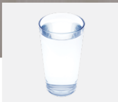
Met SpiroTrap MB3